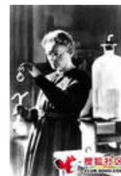
Figura 6. Marie Curie trabajando en su laboratorio.

Tras recuperarse, Marie puso en marcha la creación del Instituto del Radio, pero al finalizar su construcción estalló la Primera Guerra Mundial. Y aquella a la que habían tildado de extranjera roba maridos no dudó en arriesgar su vida y la de su hija Irène para cuidar de los soldados de adopción heridos en el frente su país. Con las camionetas denominadas “pequeñas curies”, que contenían sistemas de rayos X portátiles, Marie, su hija y las personas que ellas habían enseñado, recorrieron los frentes y realizaron más de un millón de radiografías de los soldados con heridas de bala.